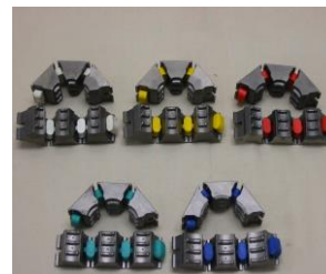
F1711 ~ F1715